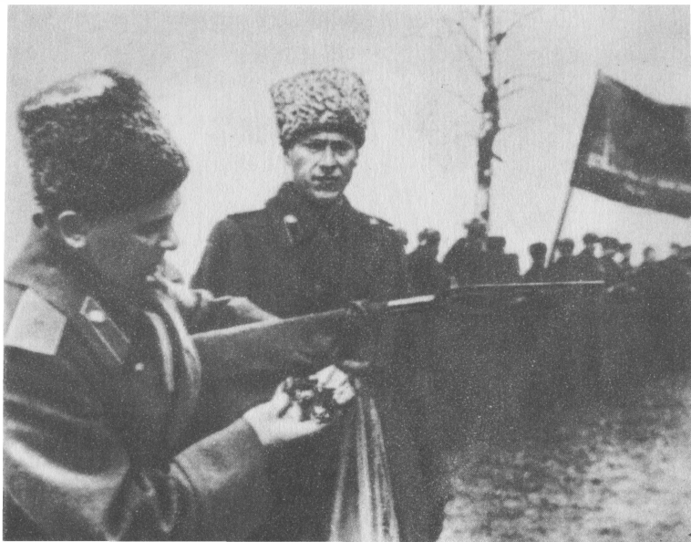
П. И. Батов прикрепляет орден Ленина к знамени 69-й дивизии.