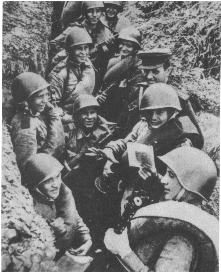
В перерыве между боями.