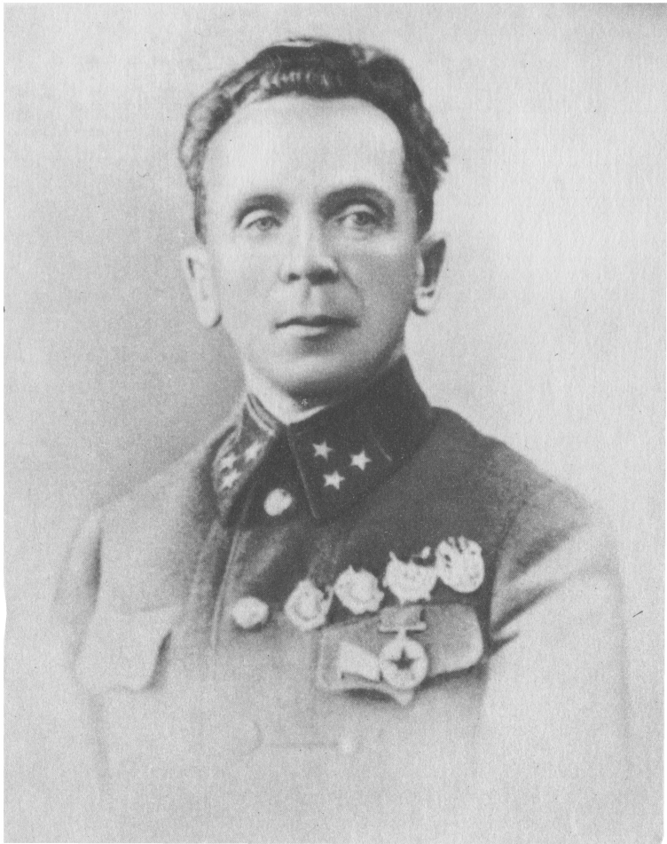
П. И. Батов. Июнь 1941 г.