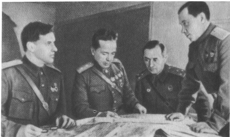
На командном пункте 65-й армии. Слева направо: И. Ф. Баринов, П. И. Батов, Ф. П. Лучко, И. С. Глебов.