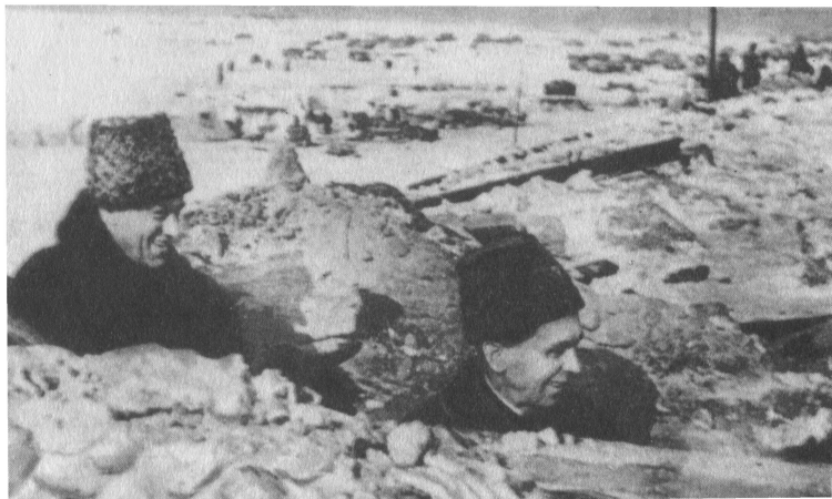
К. К. Рокоссовский и П. И. Батов под Сталинградом. 1943 г.