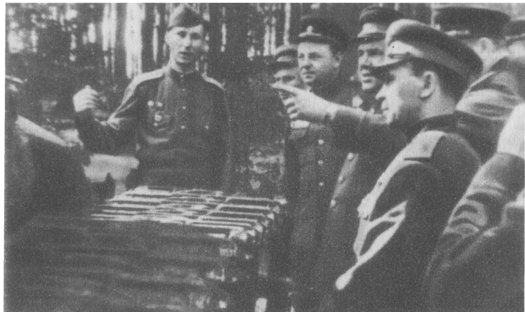
П. И. Батов у артиллеристов перед боями за Белоруссию.